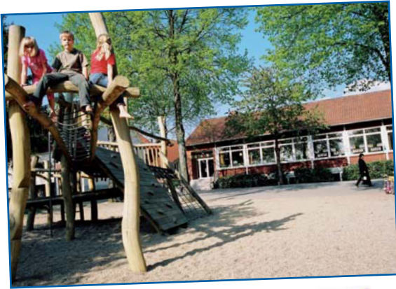
„Schulen wurden modern ausgestattet“ ✓