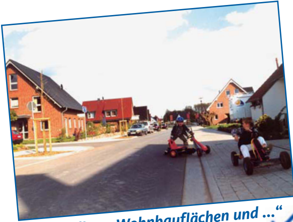
„bezahlbare Wohnbauflächen und ...“ ✓