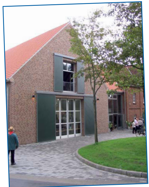
„die wertvolle Arbeit der Vereine wurde unterstützt“ ✓