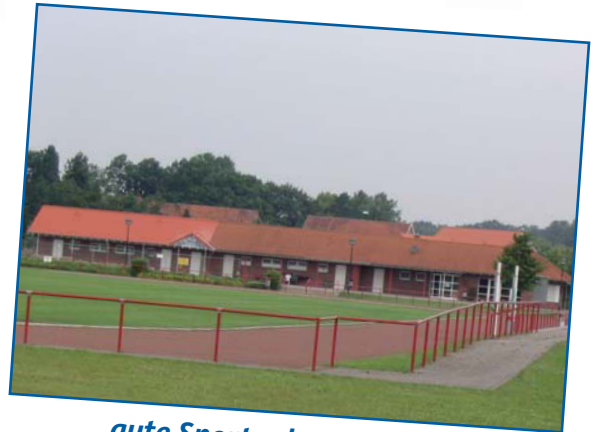
„gute Sportanlagen mit den Vereinen gewährleistet“ ✓