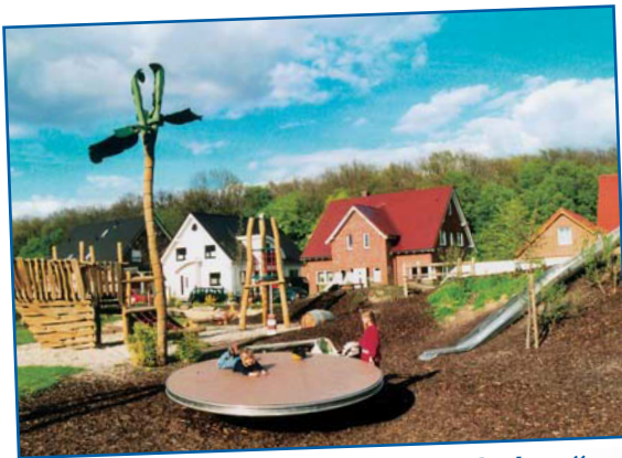
„... attraktive Spielplätze erhalten“ ✓