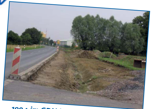
1994 im CDU Handlungsprogramm 2004: Radweg nach Hoetmar wird gebaut ✓