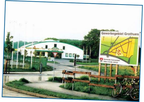
„ausreichend Gewerbe- flächen vorgehalten“ ✓