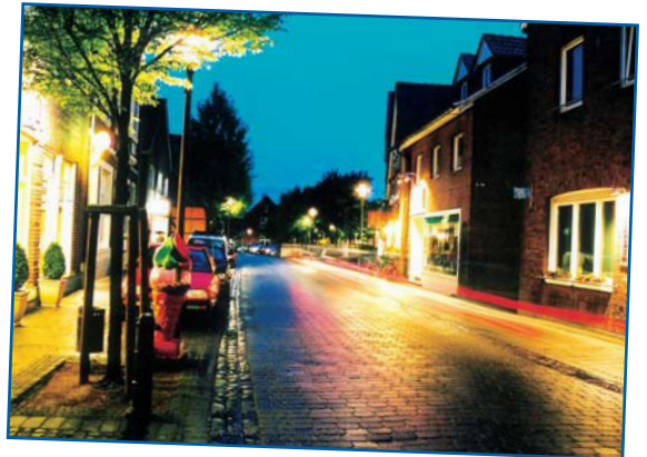
„die Geschäfte im Ort blieben gut erreichbar“ ✓